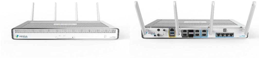
Figur 2: SmartFiber CPE (Kundeplassert utstyr)

Tjenesten inkluderer også funksjonalitet for WiFi, og enheten har medfølgende piskantenner som støtter dette formålet.